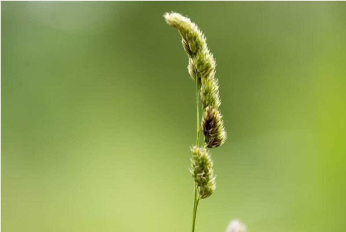
Het is stilaan grassentijd hier kroppaar