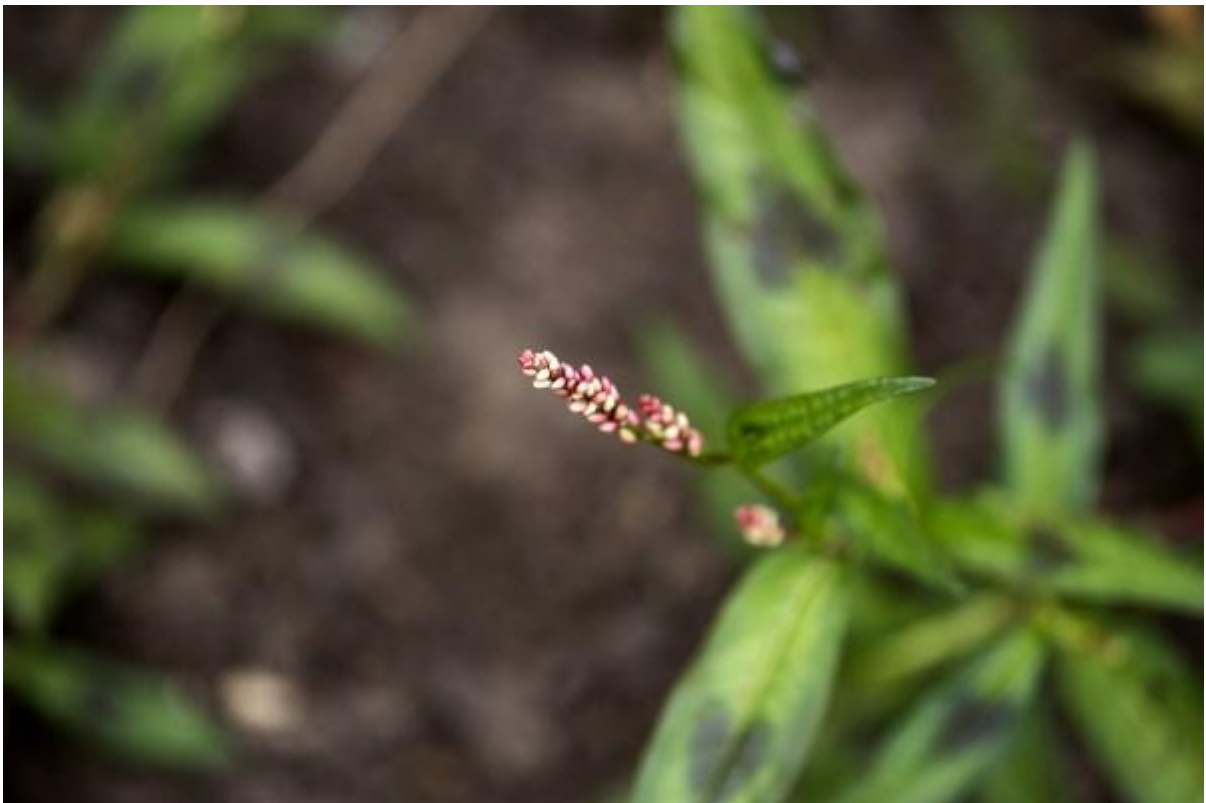
Dit was perzikkruid de waterpeper werd enkel geproefd